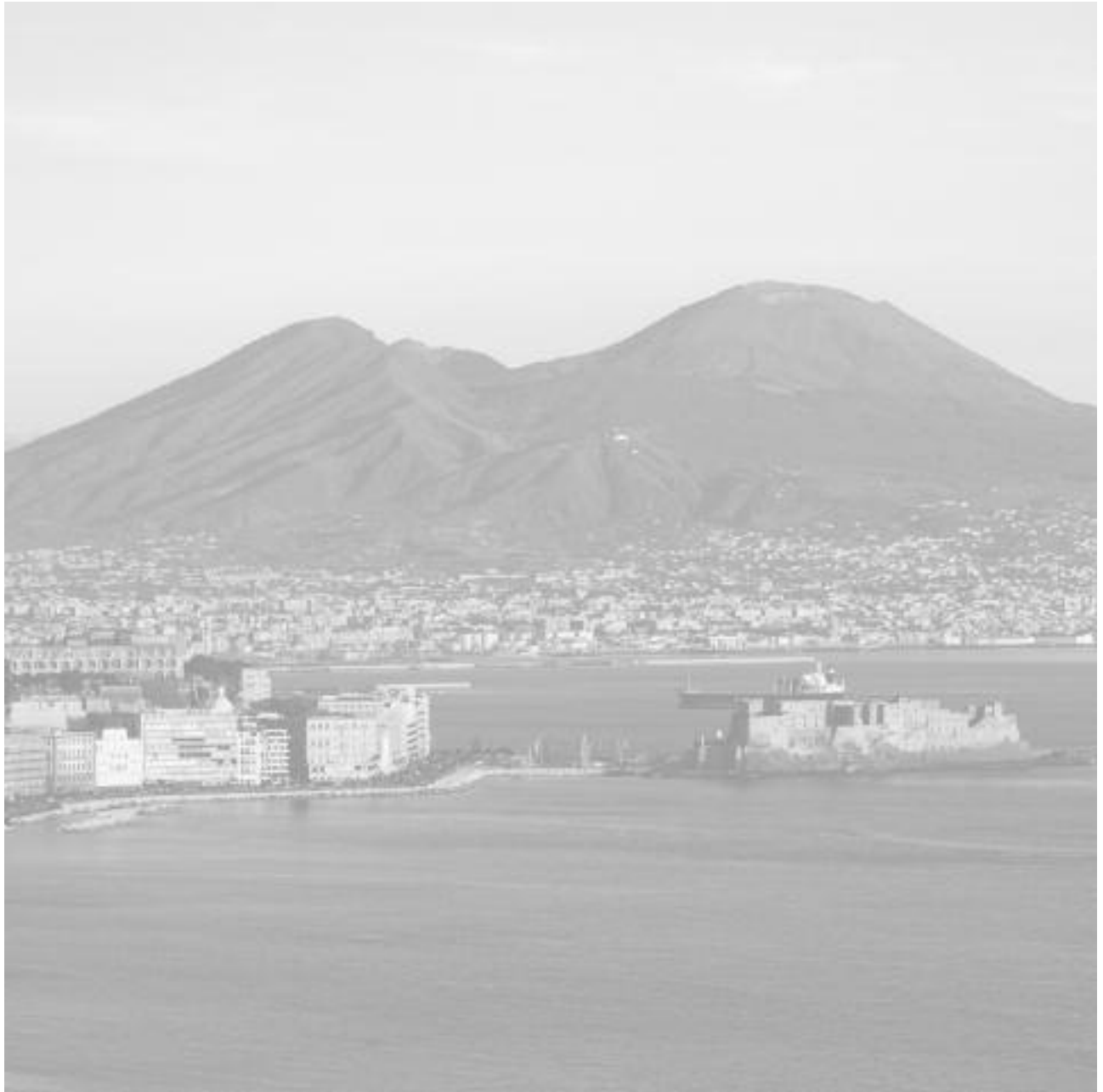
Napoli ( Naples ) Veduta del Golfo