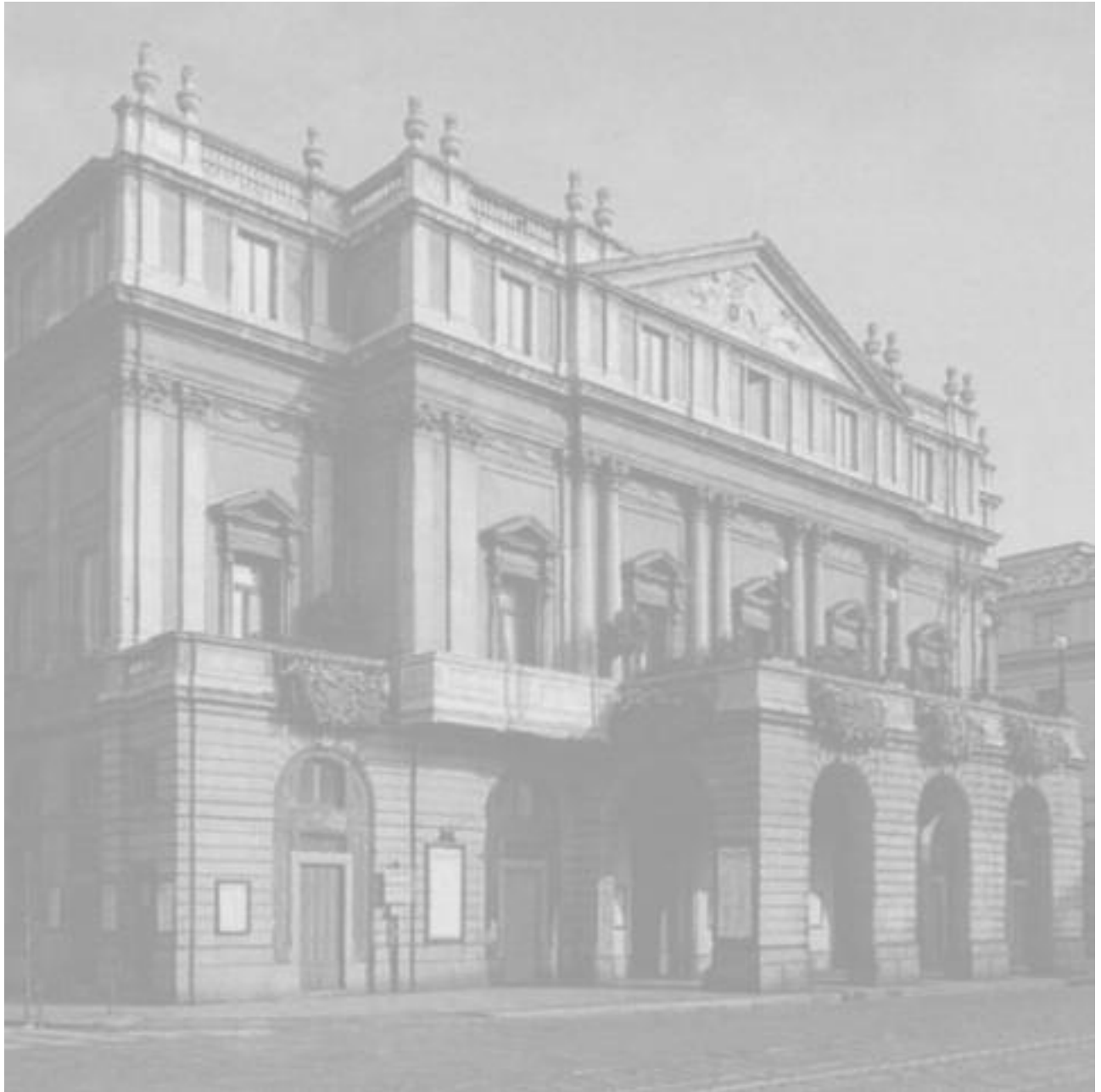
Milano ( Milan ) Teatro La Scala