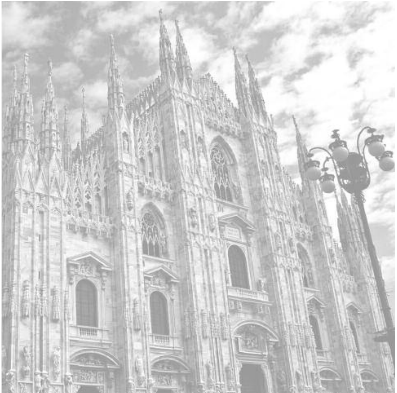
Milano ( Milan ) Il Duomo