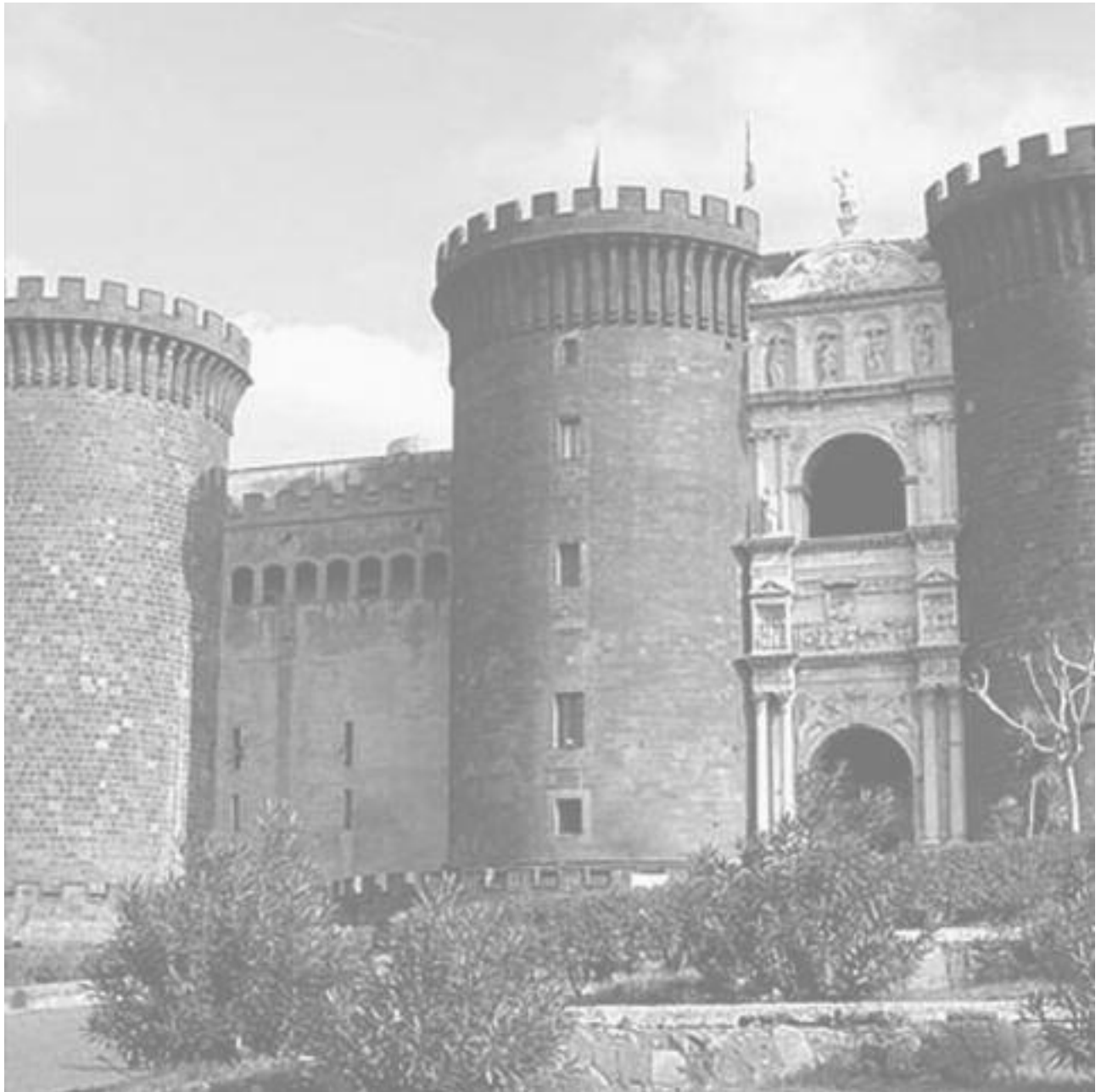
Napoli ( Naples ) Maschio Angioino